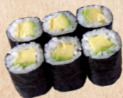
223 AVOCADO MAKI Avocado mit Sesam 3,40