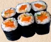
231 SPICY SAKE MAKI Lachs, Lauch, Chilisoße 1,2 3,70