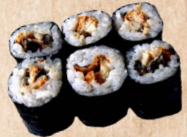
240 UNAGI MAKI Süßwasseraal a,f , Sesam 4,10