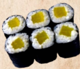
221 SHINKO MAKI Rettich 1,2 mit Sesam 3,10