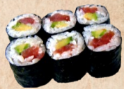
235 TEKKA AVOCADO MAKI Thunfisch, Avocado 4,10