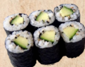
222 KAPPA MAKI Gurke mit Sesam 3,20