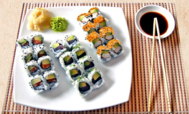
MENÜ 243 19,00 California Out Masago | Alaska Roll | Zimo Roll