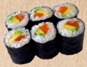
232 SAKE AVOCADO MAKI Lachs, Avocado 3,90