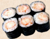
238 EBI MAKI Garnelenrolle 3,70