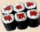
234 TEKKA MAKI Thunfischrolle 3,90