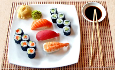
MENÜ 242 13,00 Sake, Ebi, Maguro | Sake Avocado Maki | Kappa Maki