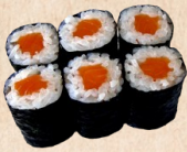
230 SAKE MAKI Lachsrolle 3,50