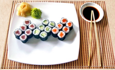
MENÜ 241 9,90 Kappa Maki | Sake Maki | Tekka Maki