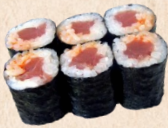
233 SPICY TUNA MAKI Thunfisch, Lauch, Chilisoße 1,2 4,00