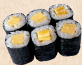
220 TAMAGO MAKI Eierstich c mit Sesam 3,10