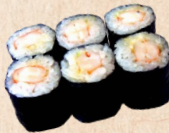
239 EBI NEGI MAKI Garnele, Mayonnaise c,f,k , Lauch 3,90